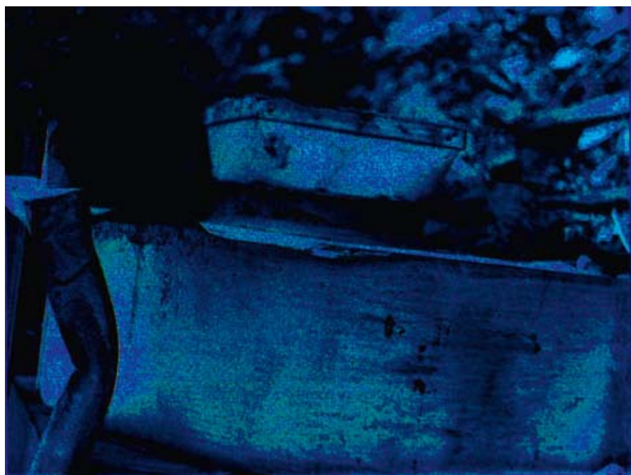
the blue symphony · 2008 · 30 x 40 cm