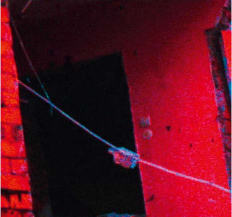
entrance · 2008 · 30,5 x 32 cm