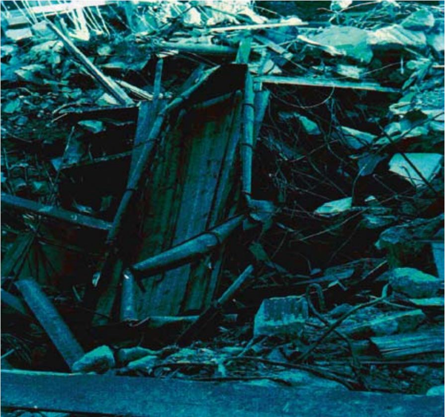
the door · 2008 · 30,5 x 28 cm