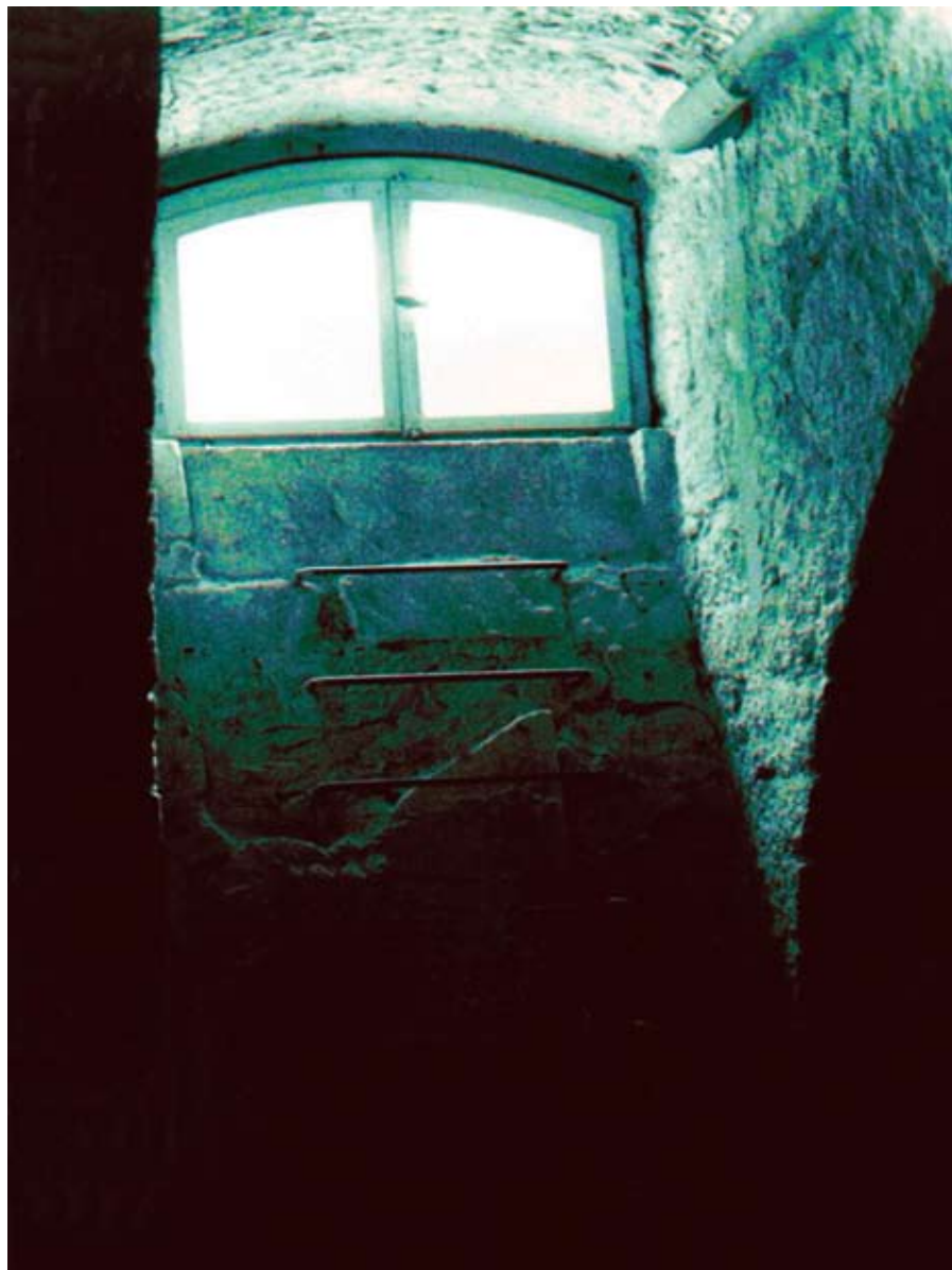
exit · 2008 · 30 x 40 cm