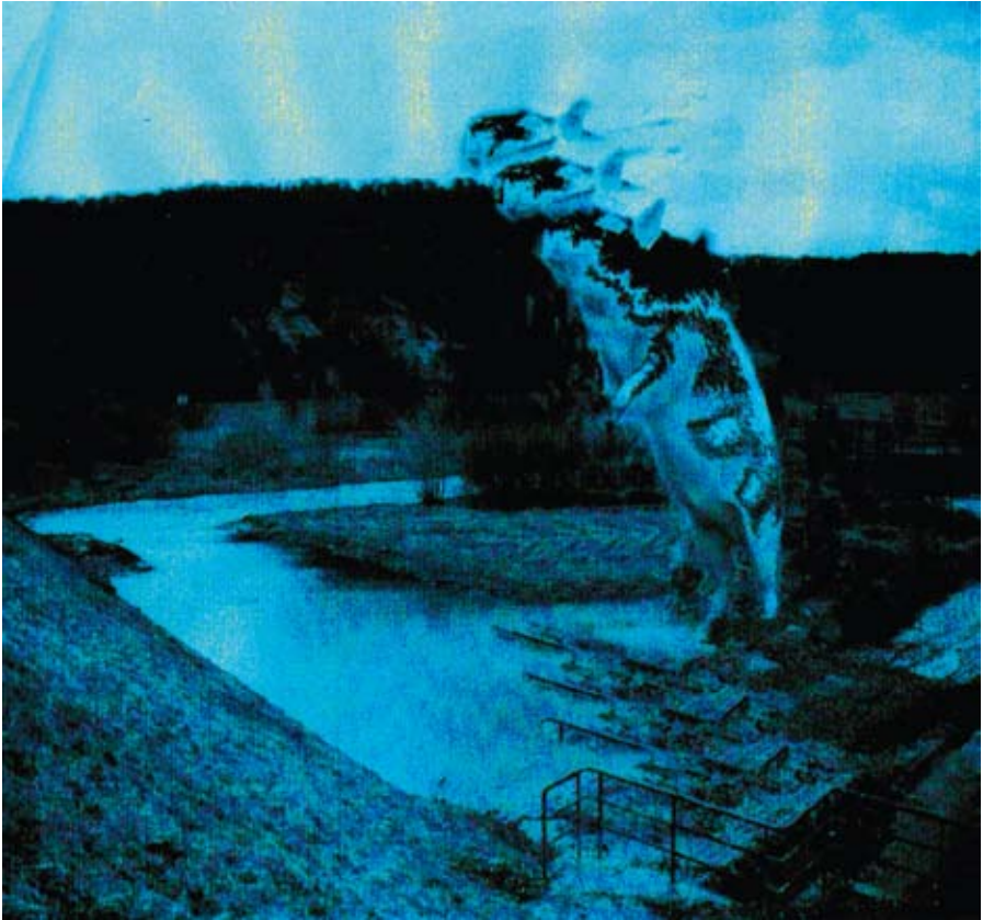
pigs are coming · 2008 · 30,5 x 28 cm