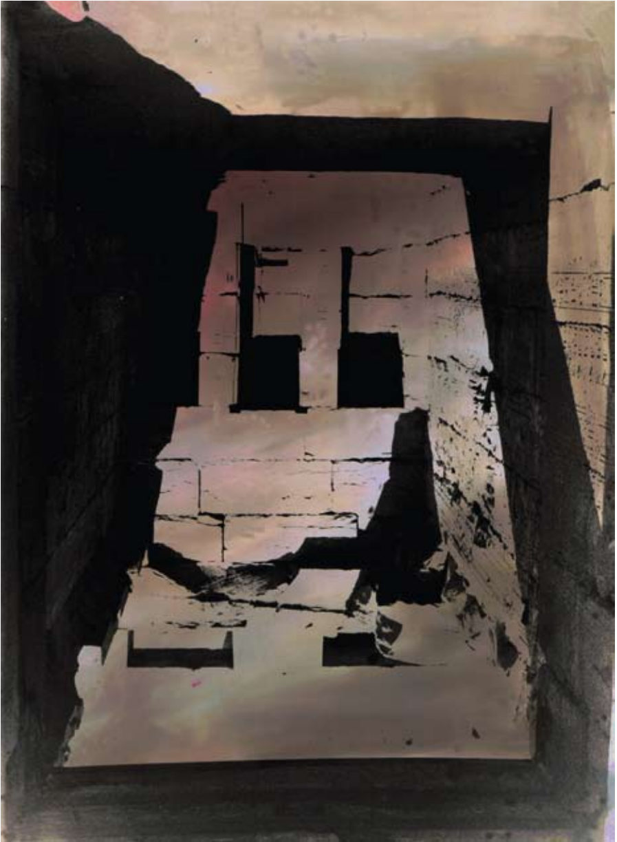
sitting in the corner · 2008 · 40 x 50 cm