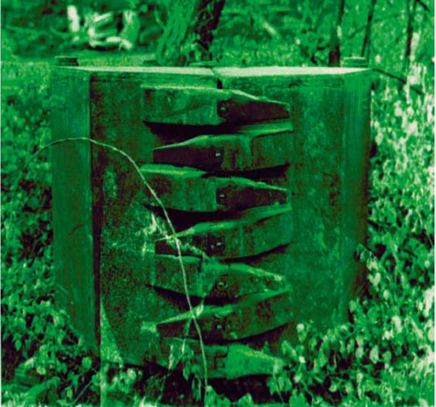
the craw · 2008 · 30,5 x 28 cm